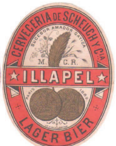
Etiquetas Chilenas anteriores a 1900, de cervecerías ya olvidadas, en las ciudades como Combarbala e Illapel